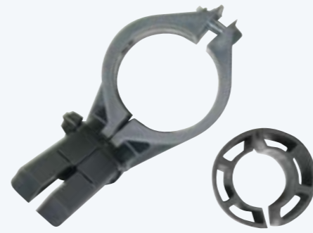
Die dem Zubehör beiliegende Feedhalterung (links) dient der Montage an einer Antenne des Herstellers FTA. Der Adapterring (rechts) dient der Montage an einer 40 Millimeter Feedaufnahme.

Halterung an jede beliebige Offset Antenne mit einer 40 Millimeter Feedaufnahme befestigt werden kann. Für die Befestigung an einer Antenne des Herstellers FTA wird eine entsprechende Halterung ebenfalls mitgeliefert. Dank des vormontierten DiSEqC-Schalters kann ein Receiver direkt an das Set angeschlossen werden. Genutzt werden kann sowohl ein analoger- als auch digitaler- oder HDTV-Satelliten-Receiver. Es muss lediglich die DiSEqC-Konfiguration im Menü des Digitalreceivers konfiguriert werden.