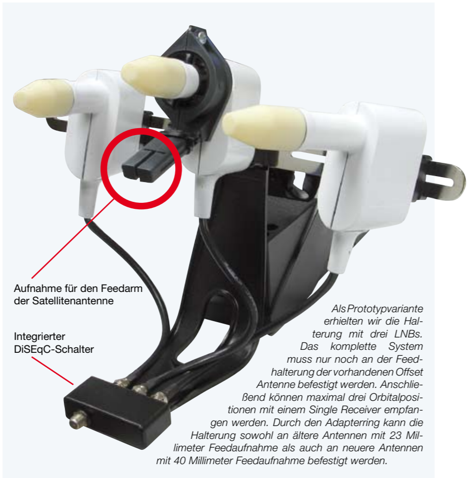
Aufnahme für den Feedarm der Satellitenantenne

Somit können auch 3°-Lösungen, wie beispielsweise Astra 19,2° Ost sowie Astra 23,5° Ost parallel empfangen werden. Der Verkaufspreis stand zum Redaktionsschluss leider noch nicht fest. Durch ein spezielles Befestigungssystem können die LNBs in alle Richtungen verstellt werden, so ist eine Vielzahl von Orbitalkombinationen möglich. Der Empfangsbereich der Multifeedhalterung liegt bei etwa 30°. Die LNBs besitzen eine Feedaufnahme von 23 Millimetern, allerdings liegt dem Zubehör ein Adapterring bei mit dem die